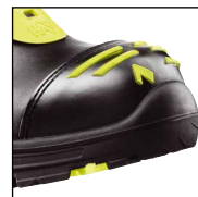
HAIX® High Durability Cap System