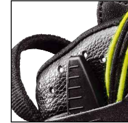
HAIX® Climate System